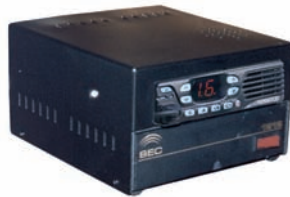
SR-10K / SR-102

Color: Negro. Aplicación en Interior. No incluyen fuentes y radios