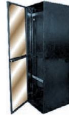
SR-1965-GAC / SR-1980-GAC