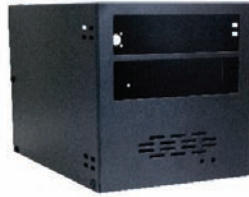
SR-40K / SR-40I